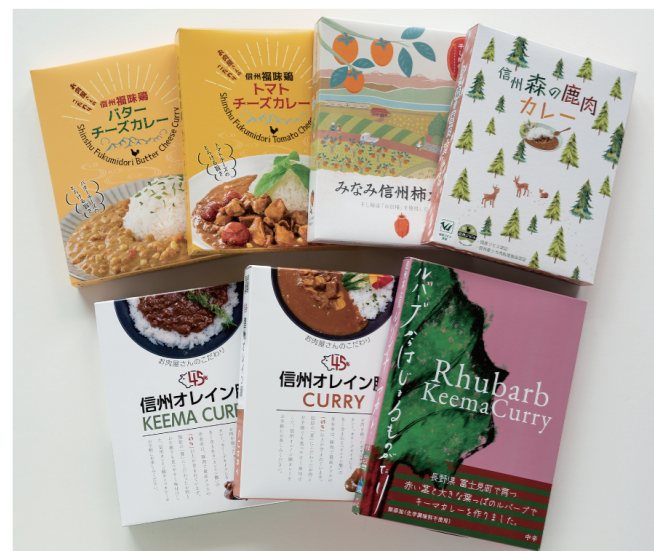
お肉屋さんのこだわりレトルトカレーセット

会場でアンケートにご協力いただいた方の中から抽選で素敵なプレゼントを差し上げます。